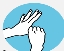
6 Большие пальцы