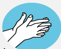
4 Между пальцами