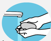
1 Намылить руки