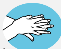
3 Обратную сторону ладоней